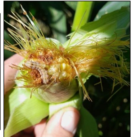
Chenilles à un stade de développement avancé (Abense-de-Haut)

Des chenilles Héliothis, à plusieurs stades de développement, ont été repérées sur des parcelles de maïs à Saint-Pée-sur-Nivelle et Abense-de-Haut. Causant des dommages sur les épis de maïs doux, maïs semences et haricots verts, il faut faire preuve de vigilance sur ces cultures.