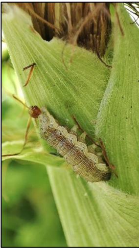
Jeune chenille (Saint-Pée-sur-Nivelle)